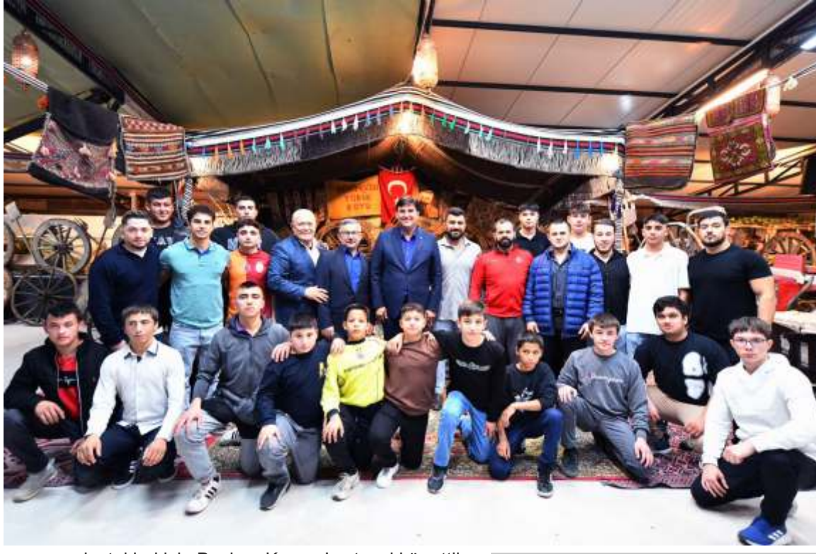
sporuna destekleri için Başkan Karaca'ya teşekkür ettiler.

Fethiye Belediye Başkanı Alim Karaca, Fethiye Güreş Spor Kulübü'nün dayanışma yemeğine katılım sağladı. Güreşçiler ve aileleri Başkan Karaca'ya büyük ilgi gösterdi. Fethiye Güreş Spor Kulübü'nün dayanışma yemeği samimi bir ortamda geçti. Güreşçiler ve aileleriyle fotoğraf çeken Başkan Karaca yaptığı açıklamada, "Fethiye Güreş Spor Kulübü sporcularımız ve aileleriyle birlik ve dayanışma yemeğinde bir araya geldik. Sporun birleştirici gücüne inanarak, geleceğin pehivanlarını yetiştirmek için özveriyle emek veren kulüp yöneticilerimize, hocalarımıza ve katkı sunan herkese teşekkür ediyorum. Bu güçlü birliktelikle Fethiye'mizde geleceğin başpehivanlarını yetiştireceğiz" dedi. Sporcu ve ailelere, güreş