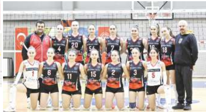
ZİRVE GENÇ TAKIM 2.