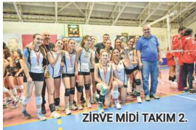
ZİRVE MİDİ TAKIM 2.